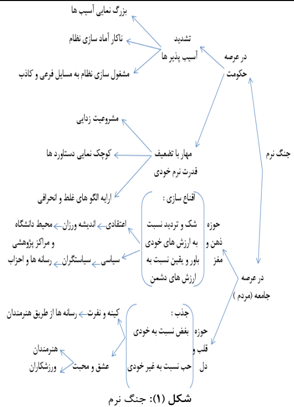
شکل (۱): جنگ نرم